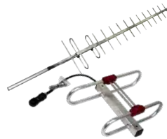
Sistemas de Comunicação Teleremoto