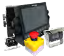
Soluções Elétricas e Eletrônicas / Câmeras de visão traseira