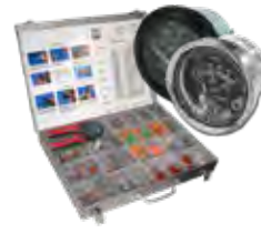
Medidores e acessórios de instrumentação