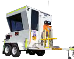
Cabine trailer para tratores de esteira (Dozers)