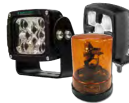
Equipamento de iluminação