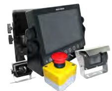
Soluções Elétricas e Eletrônicas