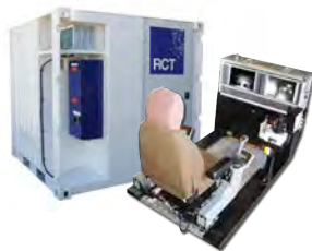
Sistemas de controle de teleremoto