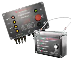
Sistemas de barreira Laser Guard