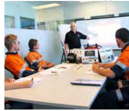
Treinamento de habilidades de produto