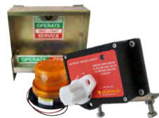
Bloqueios de combustível