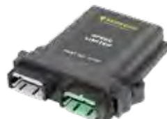
Limitadores de velocidade eletrônicos