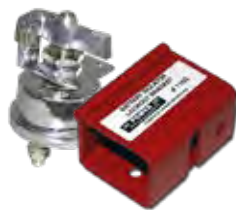
Bloqueios de bateria