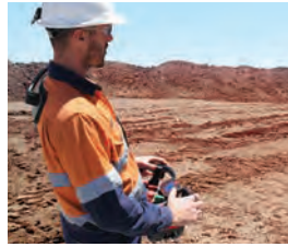
Sistemas de controle remoto (rádio)