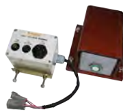
Sistema de alerta de colisão de Caçamba