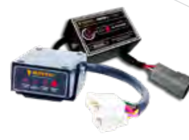
Sistemas de alerta do motor