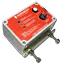
Controladores de Incêndio