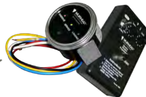
Monitores de serviço