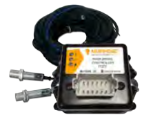
Alerta de Freio de Mão