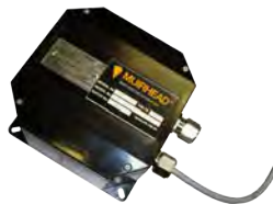
Isolamento da tampa de combustível