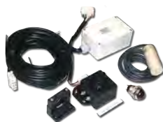
Sistema de alerta de colisão de Caçamba