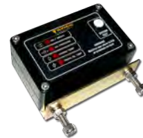
Sistemas de proteção de motores