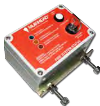
Controladores de Incêndio