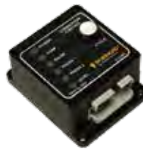
Controladores de Lubrificação