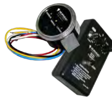
Monitores de serviço