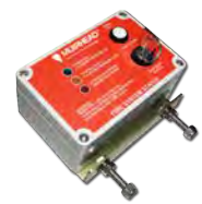
Controladores de Incêndio