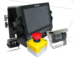
Soluções Elétricas e Eletrônicas / Câmeras de visão traseira