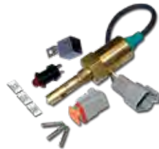
Kits de nível de Refrigeração, Óleo e Combustível