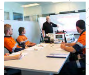
Treinamento de habilidades de produto