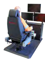
Solução de fibra óptica de superfície