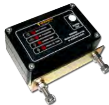
Sistemas de proteção de motores