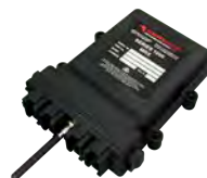
Sistemas de alerta / prevenção de colisões

Disclaimer: Images for illustration purposes only.