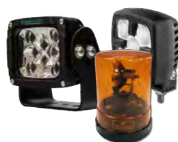
Equipamento de iluminação