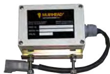
Sistema de alerta de capotagem de veículos