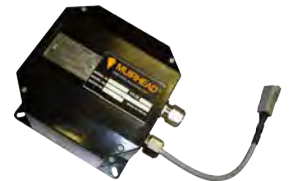
Isolamento da tampa de combustível