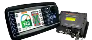
Sistemas de gerenciamento de carga (Payload)