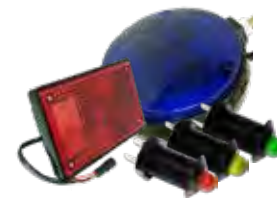
Soluções de Iluminação