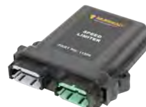
Limitadores de Velocidade