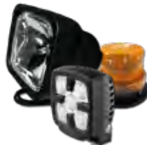
Holofotes e Luzes estroboscópicas HID