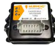
Sistemas de inatividade / desligamento