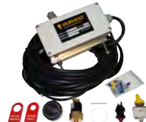
Sistemas de alerta de fadiga