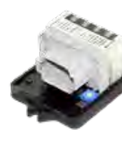
Sistema de alerta do cinto de segurança